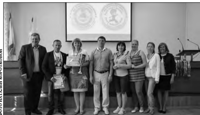
Детский сад №26 - победители группы А