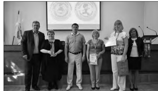
Детский сад №1 - 2 место в группе А