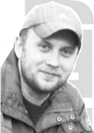
Ковровых дел мастер, специалист по ворсу.

В притчах же сын, который сначала отказал отцу в помощи, но потом засовестился и пришел ставиться однозначно выше второго, который тут-же отозвался и пообещал помочь, а так и не явился. Так что и обсуждать нечего. В своей жизни я, кажется, никогда и ничего не делал вовремя. Всегда спешил куда-то, а когда требовалось немедленно принять решение - всегда оттягивал, и часто упускал важное. Не успел сказать людям, навсегда ушедшим из моей жизни, как я их люблю. И не знаю что хуже: понимать, что любишь и не успеть сказать, или понять, что любишь, когда уже слишком поздно. Зато торопились осуждать и оскорблять. Но мне ли знать о мерах своих? Сколько на первый взгляд бессмысленного и худого обратилось в необходимое и доброе. Сколько того, чего желал отпало, оказавшись шелухой жизни. Все же и красоту рисунка можно оценить лишь на расстоянии, а не упершись в него носом.